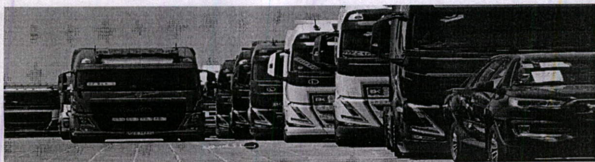
راهنمای محل شماره های موتور و شاسی کامیون و کشنده ها